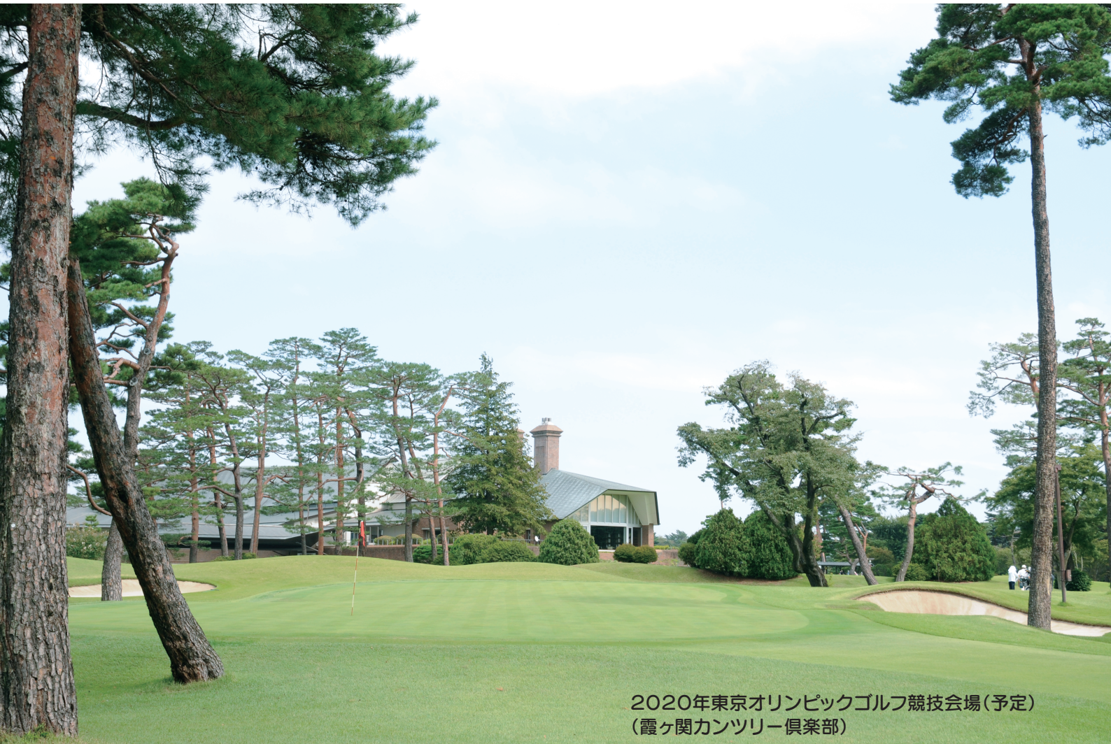
2020年東京オリンピックゴルフ競技会場(予定) (霞ヶ関カンツリー倶楽部)