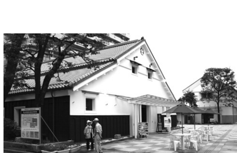
産業観光館 (旧鏡山酒造跡地)

⑥ 川越市長寿祝い金支給条例 川越市健康長寿奨励金支給条例を廃止し、高齢者に対して長寿祝い金を支給することにより、その長寿を祝福するため、当条例を制定したものです。