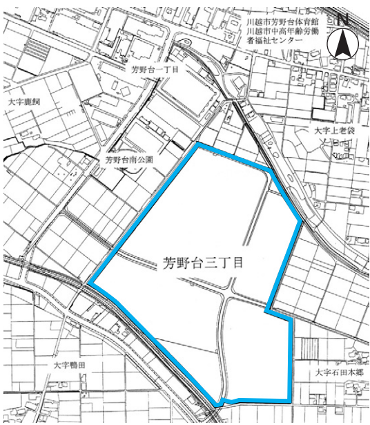
「芳野台三丁目」を画する区域

▽ 町の区域を新たに画すること（産業団地整備） 埼玉県企業局との共同事業による川越第二産業団地整備事業により公共施設の整備が完了し、新しく産業団地として整備された区域を新たに「芳野台三丁目」とするものです。