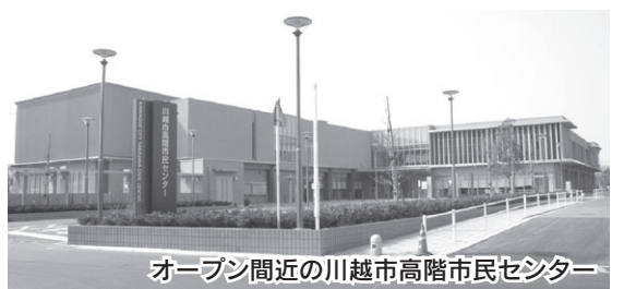
オープン間近の川越市高階市民センター