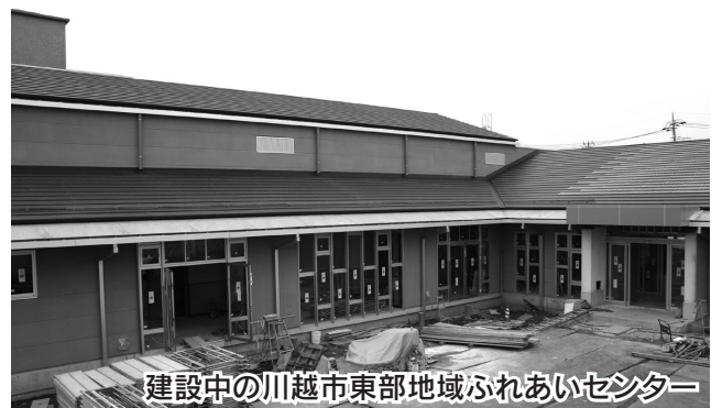
建設中の川越市東部地域ふれあいセンター

改正の内容は、川越市東部地域ふれあいセンターの設置及びそれに伴う使用料等の規定の整備、並びに指定管理者の手続きの見直し及び川越市北部地域ふれあいセンターの使用料を改正するものです。