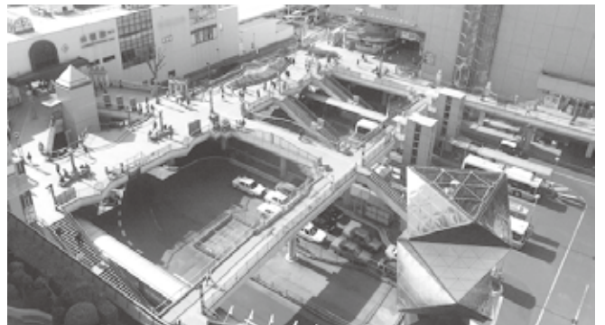
川越駅東口ペDESTロリアンデッキ