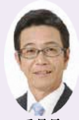
委員長 中村 文明 公明党議員団