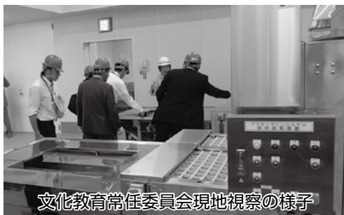
文化教育常任委員会現地視察の様子

答 事業者の説明会や募集案内などから、提案内容に基づき適切に実施されていると認識している。