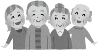
公共施設の今後の整備