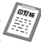
性感染症の現状と対策 自治会への支援

答 市民部長 自治会への依頼事項を全庁的に共有化することにより、市の各所管部署は、地域や自治会がどれほど多く市からの依頼事項を担っているかを把握でき、併せて