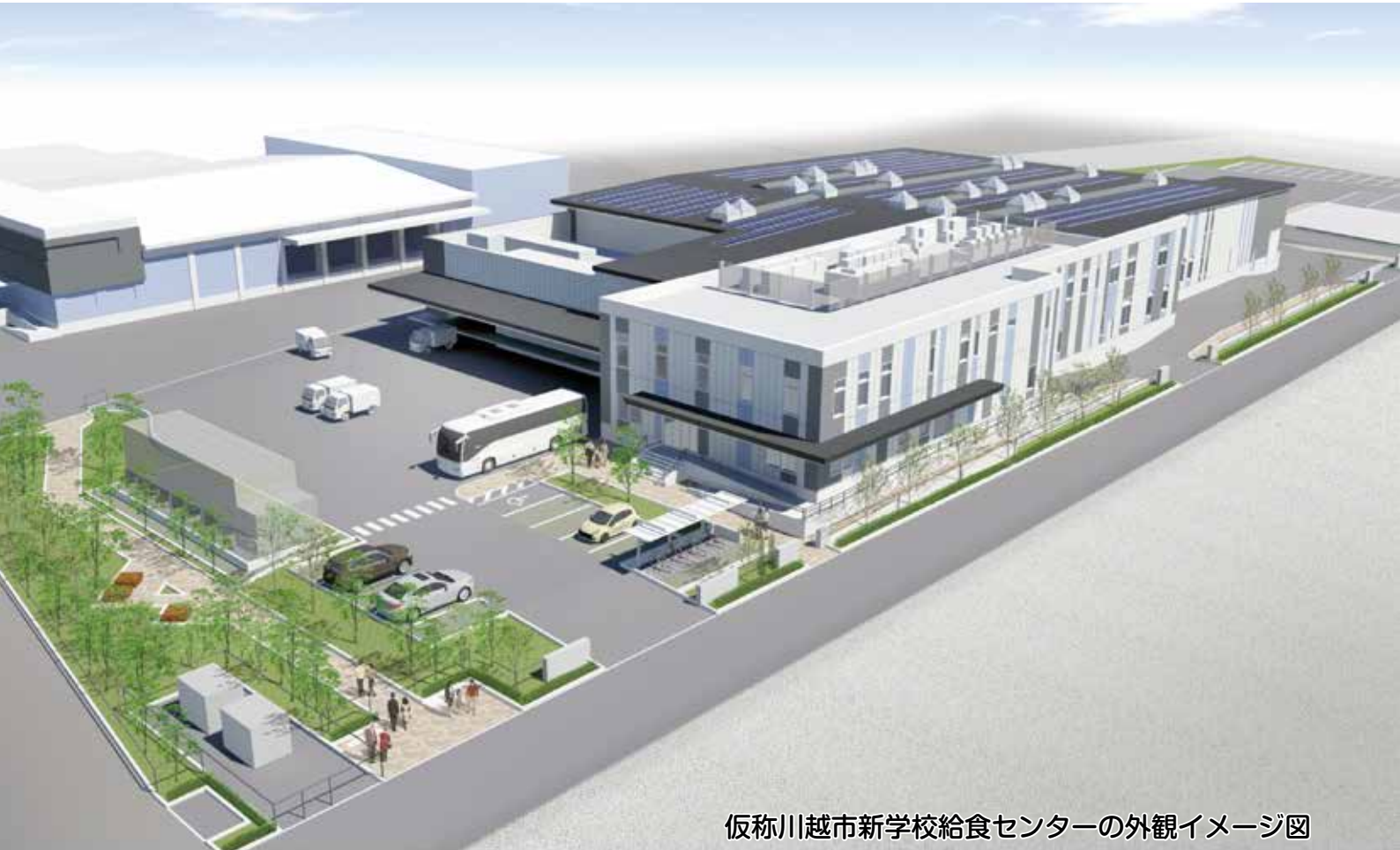
仮称川越市新学校給食センターの外観イメージ図