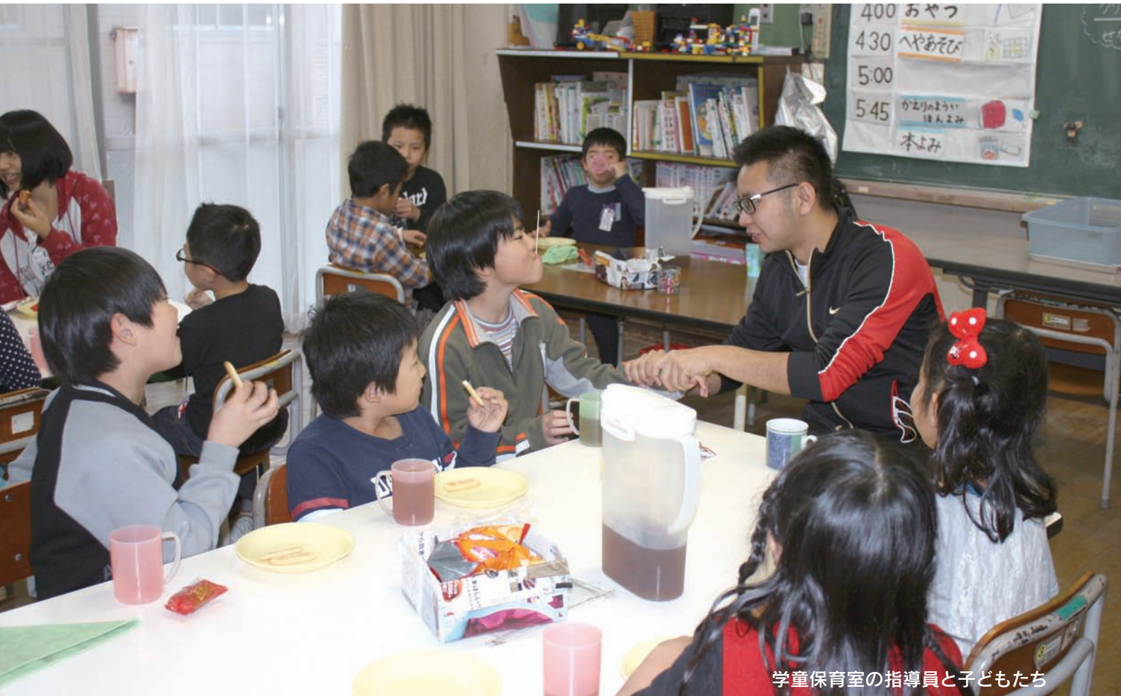
学童保育室の指導員と子どもたち