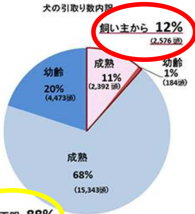
犬の引取り数内訳