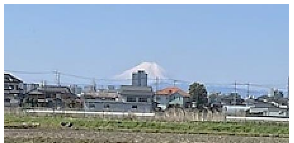
広い畑と富士山の眺めが気持ちよい