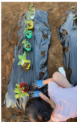
マルチを敷き、苗を植え付けていく