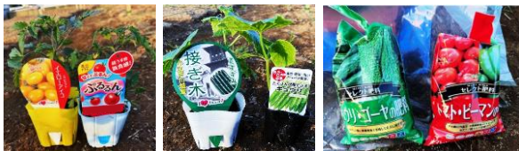
ホームセンターで購入した苗や肥料