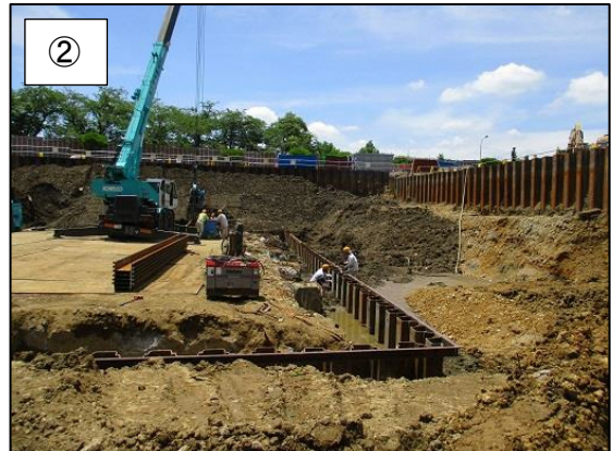
② 鋼矢板(土留め)設置の様子です。 (平成 30 年 6 月撮影)