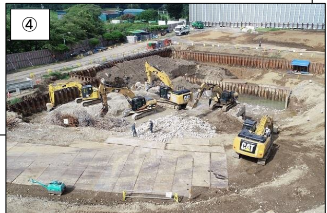
④ 工場棟地下部分解体中の様子です。 (平成 30 年 7 月撮影)