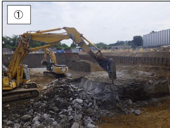
① 破砕機室地下解体中の様子です。 (平成 30 年 6 月撮影)