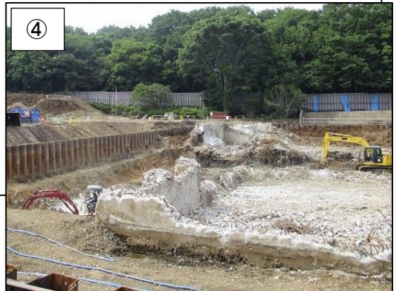
④ 土留めの内側で工場棟の基礎部分を解体している様子です。 (平成 30 年 5 月撮影)