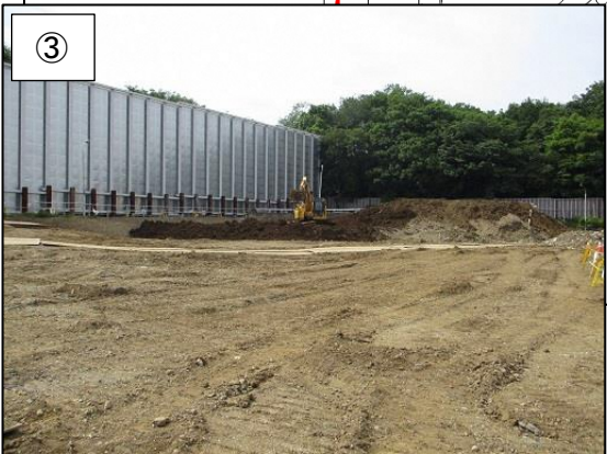
③ 不燃物処理棟の解体が完了しました。 (平成 30 年 5 月撮影)