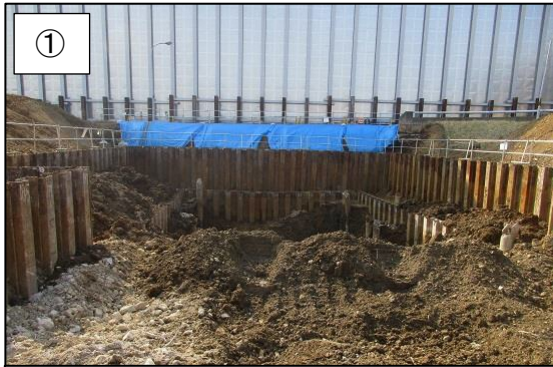
① 不燃物処理棟解体中の様子です。 (平成 30 年 3 月撮影)