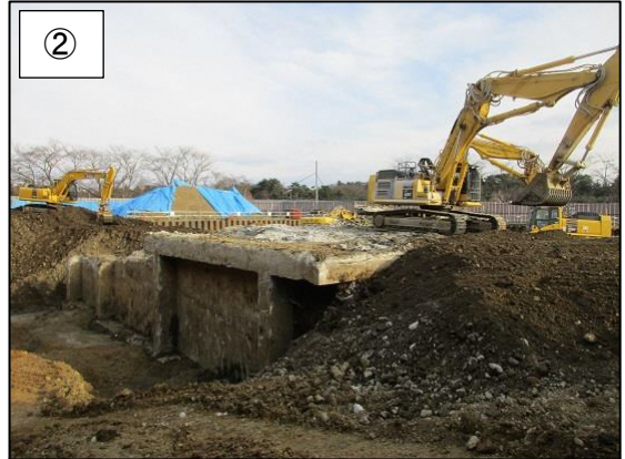
② 工場棟地下解体中の様子です。 (平成 30 年 3 月撮影)