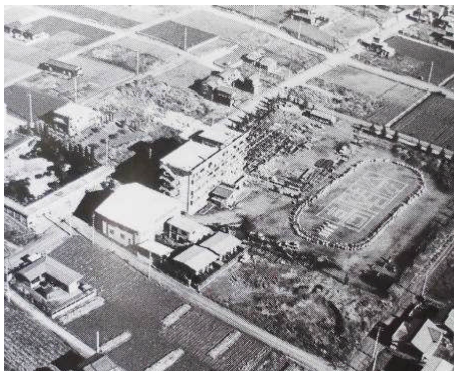
『昭和44年 分校当時の写真』

業が行われました。高階地区の方々が土地を出し合って、総合的な開発をしていこうというものでした。最初から計画的に街を作ったため、道路もまっすぐで公園もたくさん作られました。この土地区画整理事業により畑が多かったこの地区にたくさんの住宅ができ、人口が増え、当時の高階小学校だけでは校舎がたりなくなってしまうそうです。そして、昭和44年4月1日に川越市立高階小学校分校が開設されました。この分校が高階南小学校の始まりです。