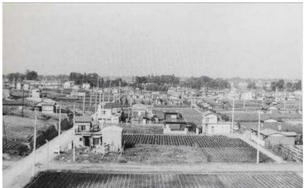
『開校当時の屋上からの風景：東上線方面』

私たち教職員も、開校47年の歴史の重みを感じながら、高階南小学校と子どもたちの教育のために尽力してまいりますので、今後ともご理解とご協力をよろしくお願いいたします。