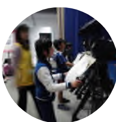
1カメラ、2カメラ！スタンバイOK