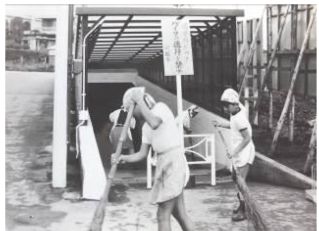
『第1回 卒業式（校庭でテントを張って）』 『昭和45年 通学用トンネル完成（国道254）』