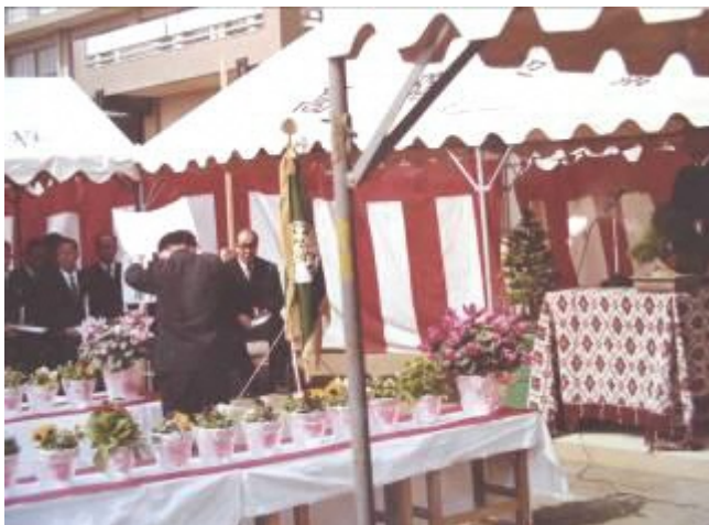
『当時の職員室（プレハブでした）』

私たち教職員も、開校48年の歴史の重みを感じながら、高階南小学校と子どもたちの教育のために尽力してまいりますので、今後ともご理解とご協力をよろしくお願いいたします。