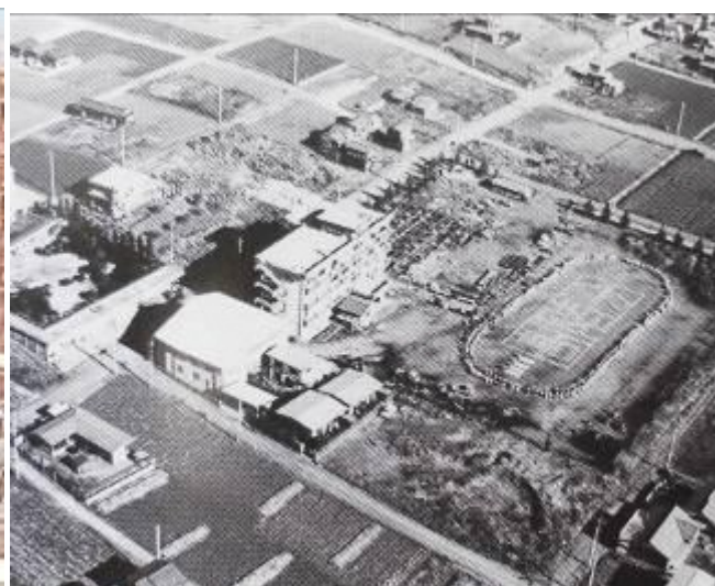
『 昭和44年 分校当時の写真 東校舎工事中 』