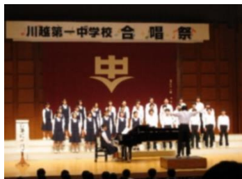
【 3-5 安久津賞 】