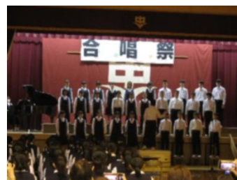
【 2-4 合唱 】