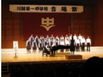
【 1-1 金賞 】

先月31日（火）に、ウエスタ川越を会場に「第77回合唱祭」が開催されました。当日は、残念ながら2年4組がインフルエンザのため学級閉鎖となつてしまい、ウエスタ川越で合唱を披露することができませんでしたが、今月8日（水）に多くの教職員と3年生を中心とした有志生徒の協力により、体育館で合唱を披露することができました。ウエスタ川越と体育館に御来場いただいた保護者の皆様に厚く御礼申し上げます。