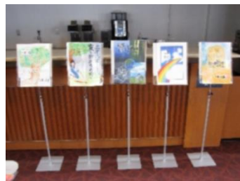
【 クラス絵画 】