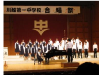
【 3-2 金賞 】