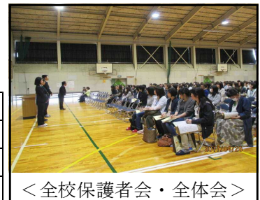
<全校保護者会・全体会> (全校家庭数：294) (出席率77%)