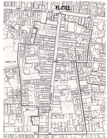
川越市川越伝統的建造物群保存地区の範囲