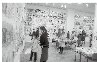
昨年度の展示会の様子