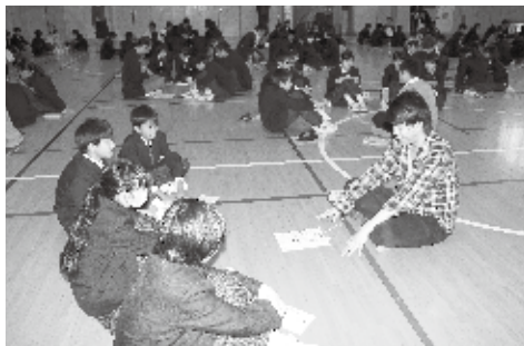
仕事を選ぶうえで大切なこととは？ 「お金」「家族」「社会貢献」「夢」

今年度は一年生の授業で、講師一人に対して四〜五名の生徒でグループをつくり、車座になって話し合いをします。各グループの話し合いは、生徒が四種類のカード(「お金」「家族」「社会貢献」「夢」)を、仕事を選ぶうえで大切だと思う順に並べ、その理由を発表し、それに対して、講師がコメントをするという形で進められていきます。講師は、途中で二回、入れ替わります。