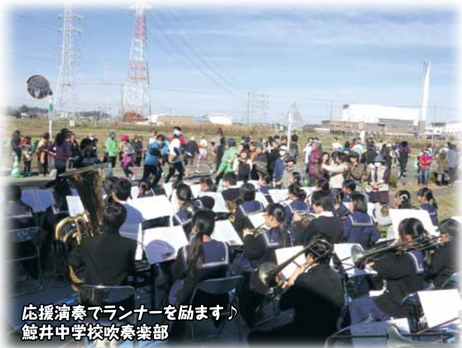
応援演奏でランナーを励ます♪ 鯨井中学校吹奏楽部