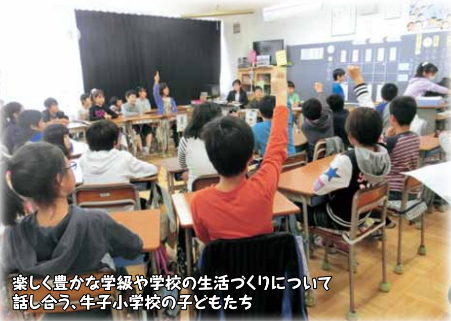
楽しく豊かな学級や学校の生活づくりについて 話し合う、牛子小学校の子どもたち

平成27年11月24日(火)、牛子小学校で、特別活動研究発表会が開催されました。「主体的に活動できる心豊かな児童の育成」を研究主題として、10学級が授業公開を行い、市内外から150人を超える教員が参加しました。