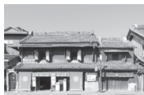
蔵造り資料館耐震化