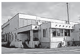
学校給食施設の整備