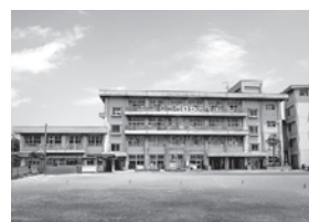
南古谷小学校増築