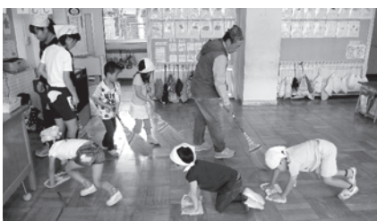
きれいな教室は気持ちがいいね！（写真は武蔵野小学校の様子）