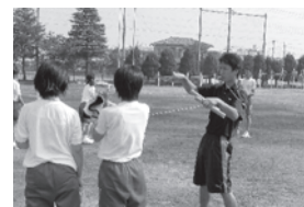
オールマイティーチャーター配置事業