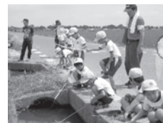
わあーい、ザリガニつり