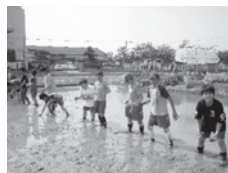
自分たちで植えました!