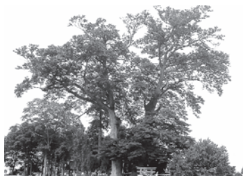
下小坂の大ケヤキ