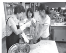
本式です。藍染め体験