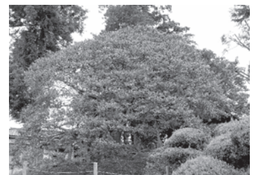
砂氷川神社のイヌツゲ