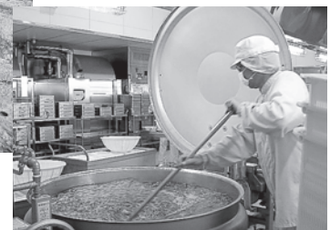
▼調理中!! 大きなお釜で色よく茹で上げます。