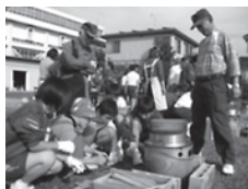
すでい。釜で直火炊き体験

そして楽しみの収穫祭。新 まき をくべた釜で最高の炊きたてご飯、学校ファームで収穫したさといも・大根・人参・小松菜・じゃがいもの具だくさんの味噌汁、さつまいもなどを感謝しながら頂きました。生徒も先生も地域の方も笑顔あふれるホットなひとときでした。