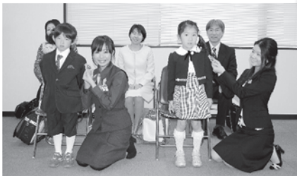
川越市には全部で2,979枚のワッペンが贈られました。