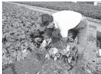
▲収穫中!! 1株に30個くらいのさやがついています。