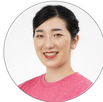
NHKテレビ・ラジオ体操アシスタント