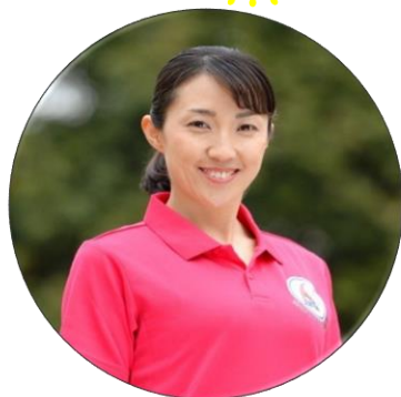
全国ラジオ体操連盟指導委員